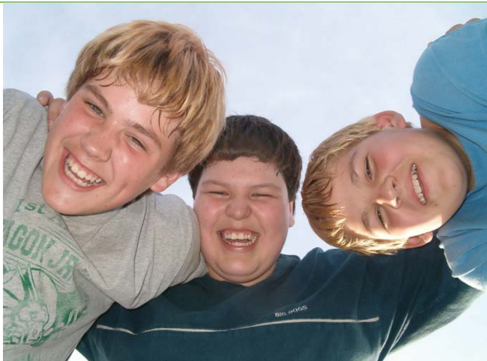
La recerca ha permès analitzar l'escolarització dels nois i noies tutelats que tenien entre 15 i 16 anys durant el curs 2009-10 i comparar-la amb la dels seus companys

1. De la mostra de l'estudi, els nois i noies en centre residencial són els que presenten pitjors resultats en tots els àmbits: el 16,5% són absentistes, el 38,2% presenta greus problemes de comportament a l'escola i només un 27,3% està a 4t d'ESO. Conseqüentment, és on hi ha menys graduats, menys orientacions a batxillerat i més abandonament escolar. Els investigadors expliquen aquestes dades pel fet que als centres hi ha nois i noies que no han pogut gaudir d'una família d'acollida o adoptiva, o bé que